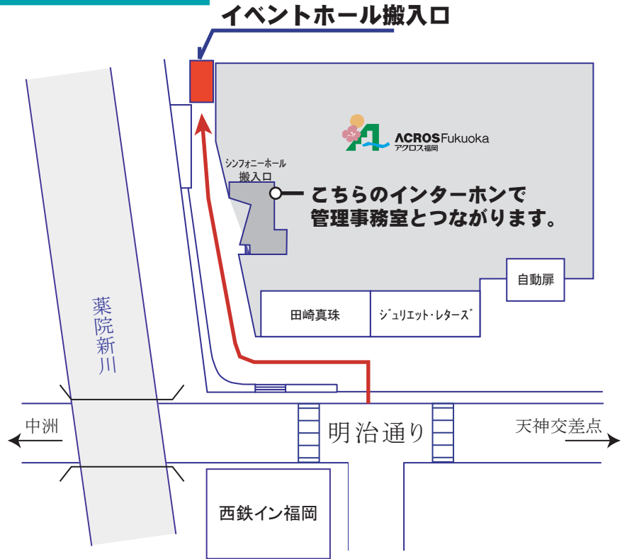
東側搬入車輛入口