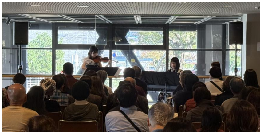
2025.11.15 アクロス・ミュージックキャラバン in 福岡県立美術館 より

今回は、プラネタリウム国際会議2026の関連事業である、企画展『星空をつくる物語～プラネタリウムの歴史と未来～』での開催となります。