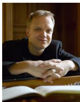
アンティ・シーララ(ピアノ)