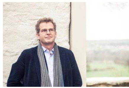
ミヒヤエル・ゲールケ(声楽)