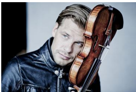
キリル・トルソフ(ヴァイオリン)