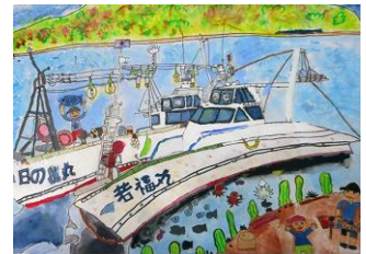
第58回県知事賞受賞作

子供たちが海や漁業に興味を持ち、漁業の発展や環境保全、資源保護へと繋がることを期待し「海の子児童作品展」を開催致します。