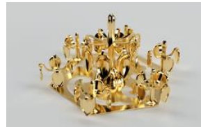
金銅製歩揺付飾金具 （こんどうせいぼうようつき かざりかなく）

「船原古墳」を知っていますか？古賀市にある前方後円墳で、実は全国的に珍しい古墳なのです。一体何が珍しいのでしょうか。今回の企画展では、船原古墳の魅力について紹介します。船原古墳を知らない方や古墳に興味がない方もこの機会にご覧ください。（約20点展示）