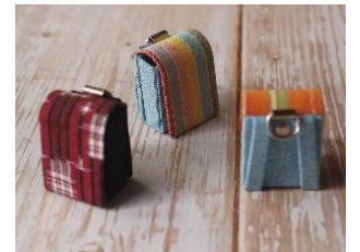
▲久留米絣 ミニランドセル