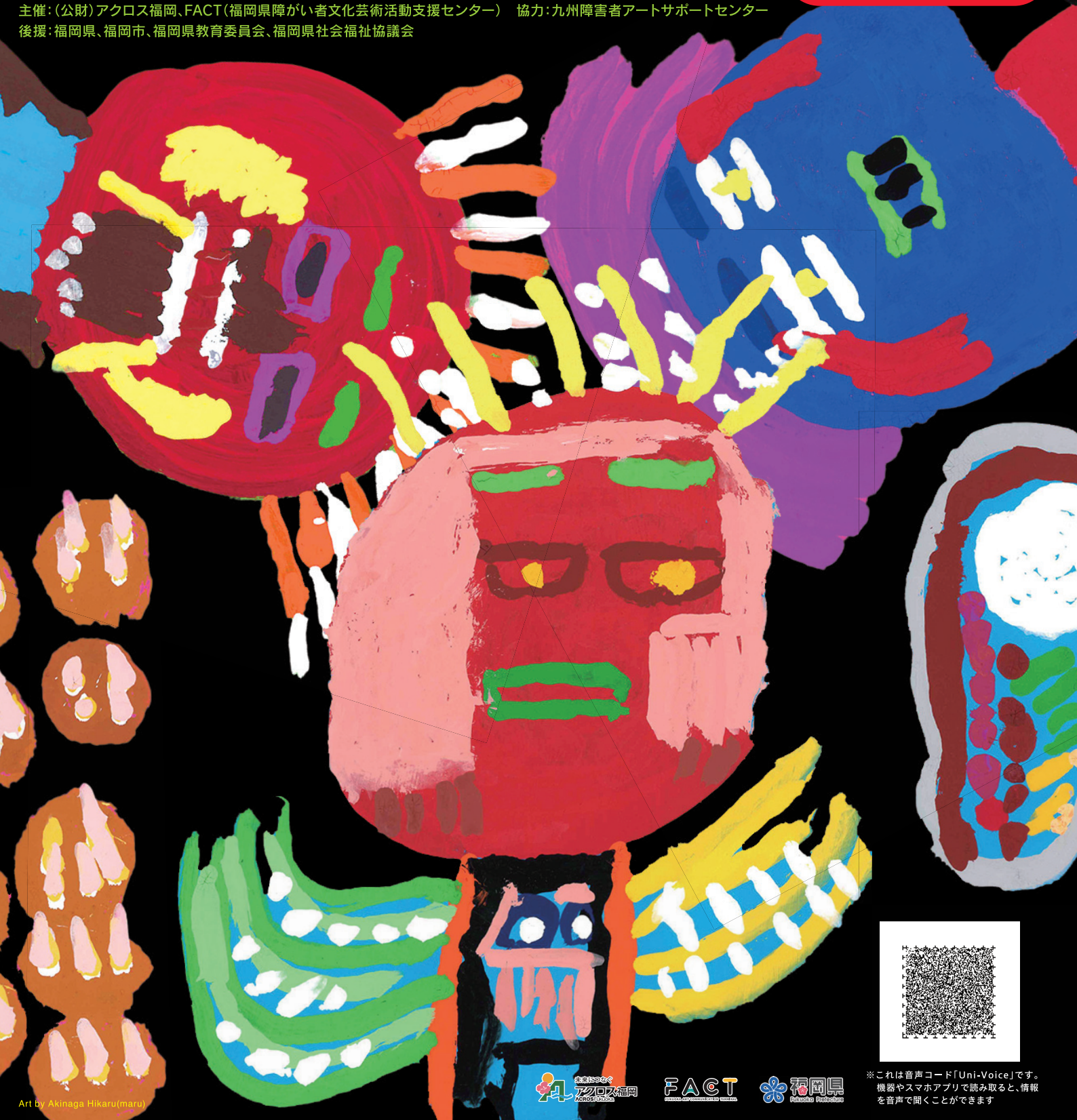
Art by Akinaga Hikarumaru

主催:(公財)アクロス福岡、FACT(福岡県障がい者文化芸術活動支援センター) 協力:九州障害者アートサポートセンター 後援:福岡県、福岡市、福岡県教育委員会、福岡県社会福祉協議会