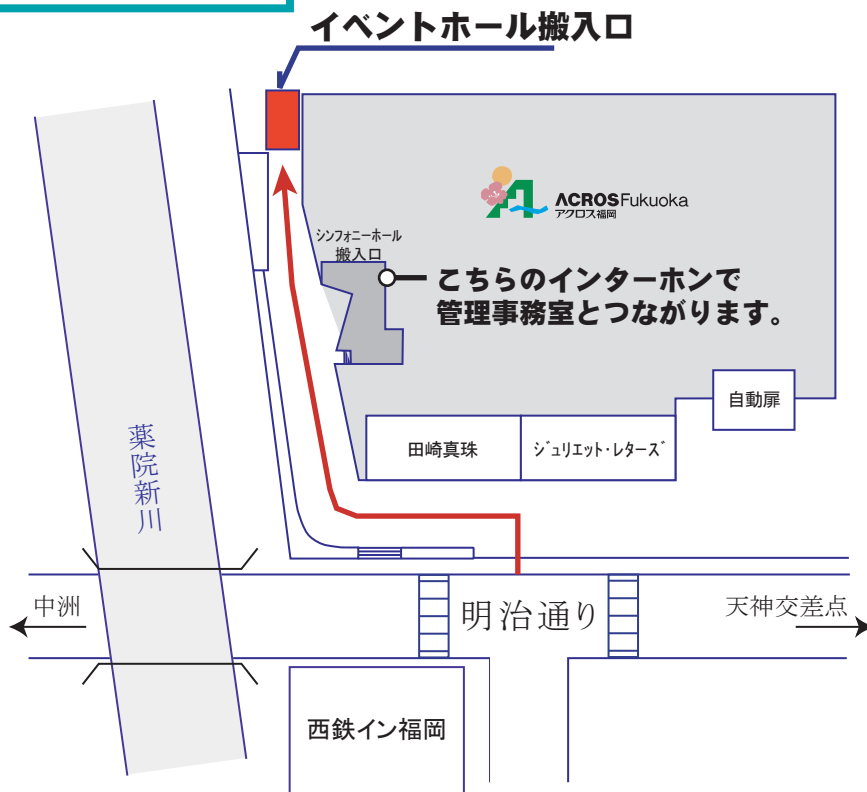
東側搬入車輛入口