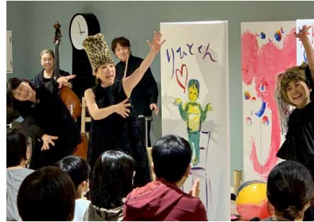
美術館等と連携した音楽アウトリーチ事業 等