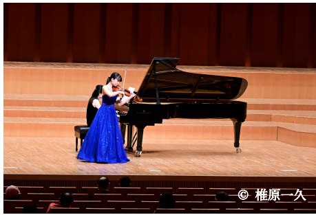
ヴァイオリンセミナー (プロを目指す小学生から高校生を対象)