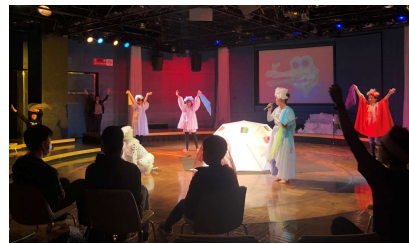
こども文化芸術体験 等 (里親家庭を対象) R5.3.25/R6.3.3