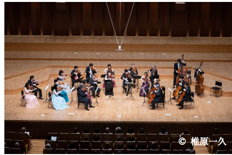
アクロス弦楽合奏団 R5.3.21 等